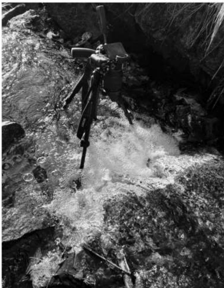
Obrázek 17- Nahrávání videa a zvuku digitální kamerou – Jizerský potok.